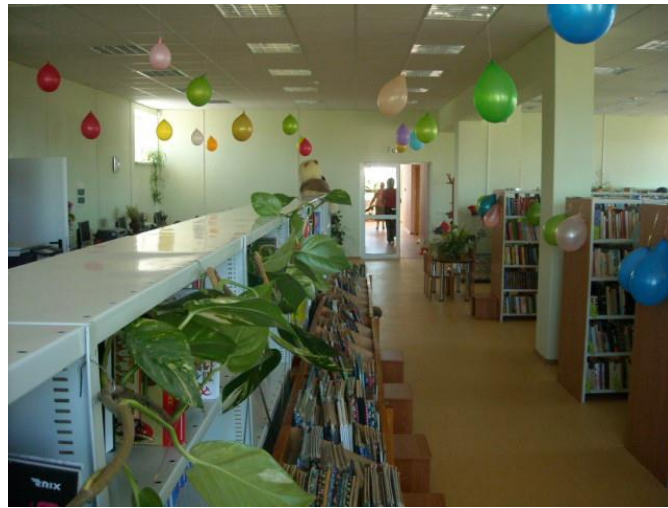
Bērni apkalpošanas nodaļa pēc rekonstrukcijas