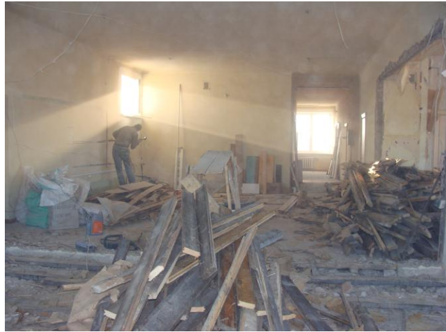
Remontdarbi Bērnu apkalpošanas nodaļā